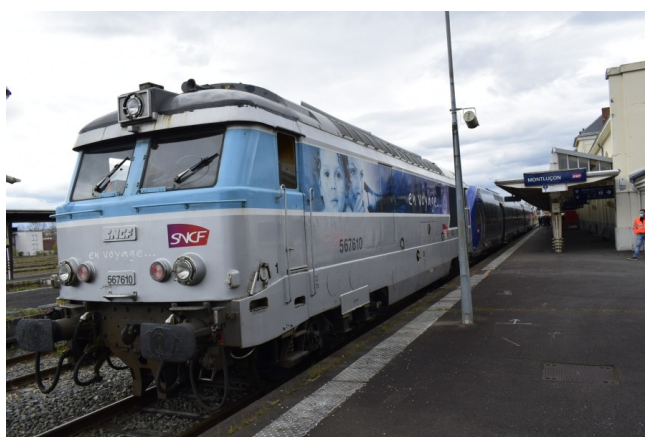
La rame présentée en gare

La rame présentée était en piteux état et incapable d'être autonome puisque tractée par une Diesel.