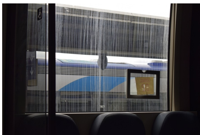
État de propreté de la rame présentée